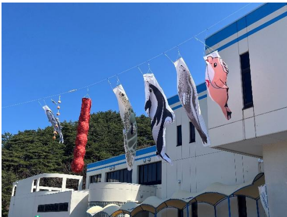
いるかのぼり（一部）

【種類】こころ、カマイルカ、ゴマフアザラシ、ウミガメ、マボヤ、ホタテ、クロマグロ(大)、クロマグロ(小)、アユ、ニホンウナギ、こいのぼり(4種)、クジラ、モリアオガエル(繁殖)、ニホンザリガニ(繁殖)